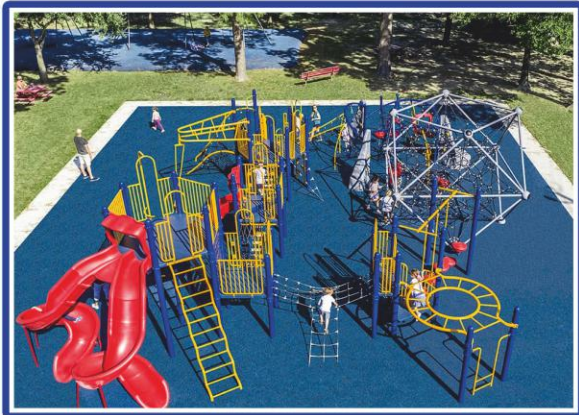
खेल का मैदान