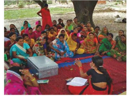
गाँव की लड़कियों का सशक्तिकरण