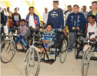
विकलांगों को जरूरी उपकरण वितरण