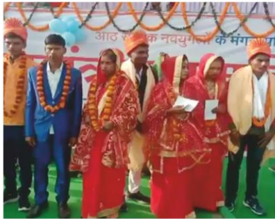
बेटियों के लिए सामूहिक विवाह आयोजन