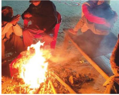
सर्दियों में राहत