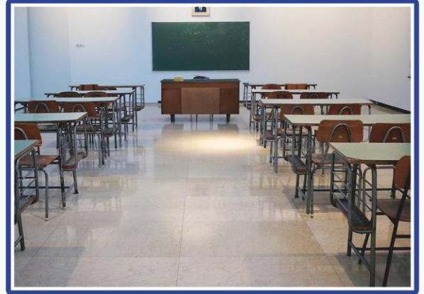
आधुनिक कक्षाएँ एवं श्रेष्ठ शिक्षक