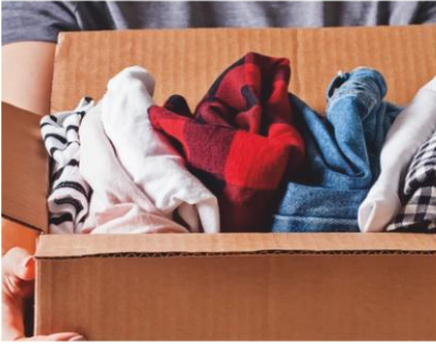
पुराने अनुपयोगी कपड़ों का वितरण