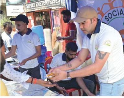
शुद्ध एवं शाकाहारी भोजन वितरण