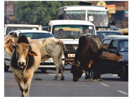
निराश्रित व आवारा पशुओं की देखभाल