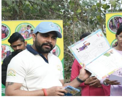
बच्चों की शिक्षा सहायता